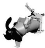
MISTURADOR DE ALTA VELOCIDADE